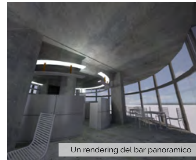
Un rendering del bar panoramico

Nel torinese, territorio coinvolto in modo sostanziale dal progetto "torri dell'acqua", alcune delle proposte si stanno pian piano concretizzando. Chissà se in futuro anche il nostro acquedotto vedrà cambiare la propria pelle, trasformandosi e trasformando radicalmente lo "skyline" scarnafigese.