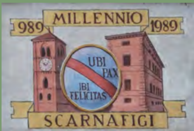
Il logo del Millennio di Scarnafigi dipinto sulla facciata della canonica.