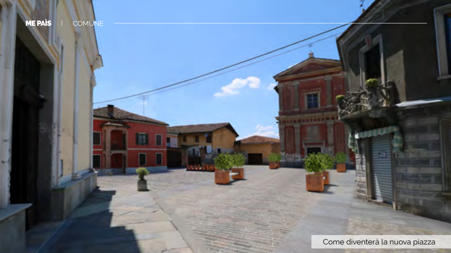
Come diventerà la nuova piazza