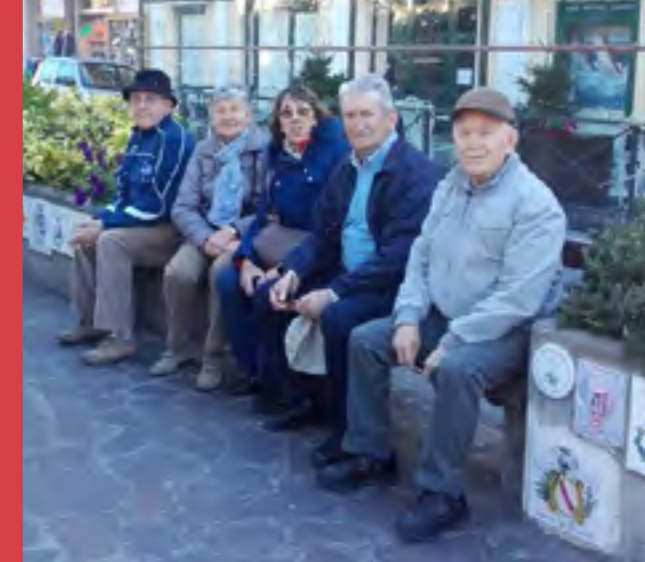
Soggiorno marino ad Alassio, affezionatissimi dell'hotel Belsit, visitano la piastrella raffigurante lo stemma di Scarnafigi sul famoso muretto.