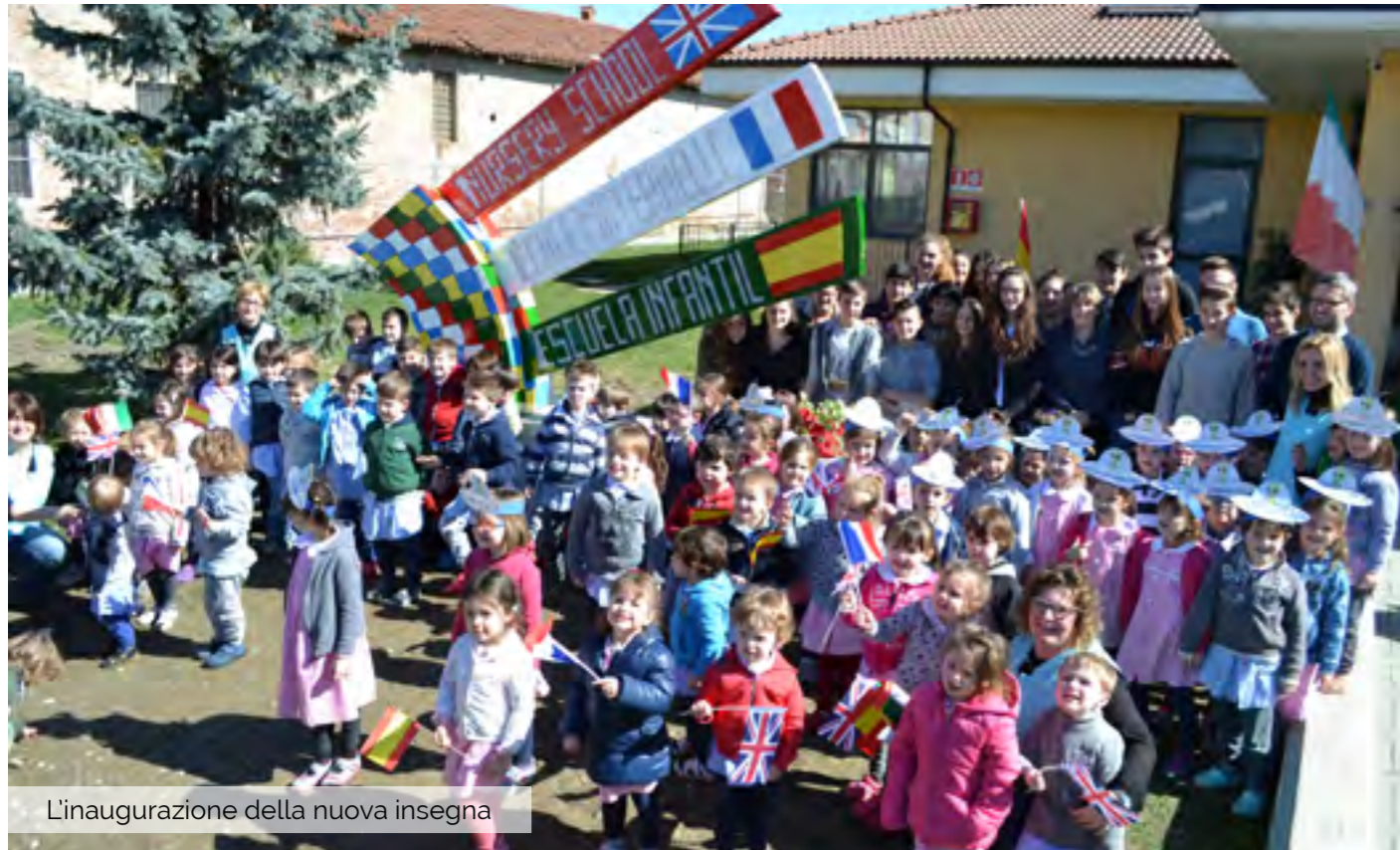
L'inaugurazione della nuova insegna