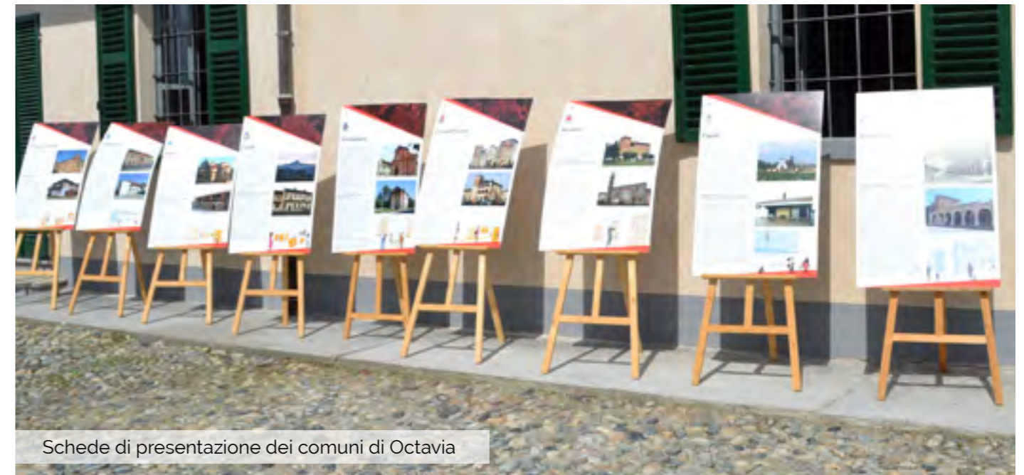
Schede di presentazione dei comuni di Octavia

al laghetto, dove esperti accompagnatori hanno intrattenuto i ragazzi e i bambini con storie fantastiche, pitture e giochi. A seguire, con la collaborazione della