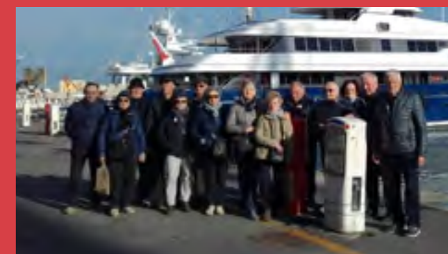
Escursioni durante il soggiorno marino