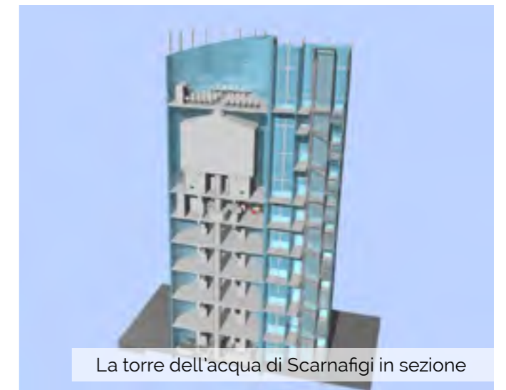
La torre dell'acqua di Scarnafigi in sezione