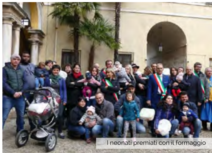
I neonati premiati con il formaggio