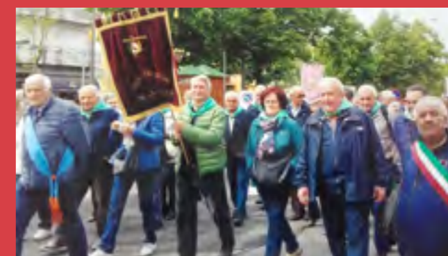
Raduno centro anziani a Galliate, corteo di apertura della manifestazione seguito dalla santa messa e dal pranzo nei ristoranti cittadini.