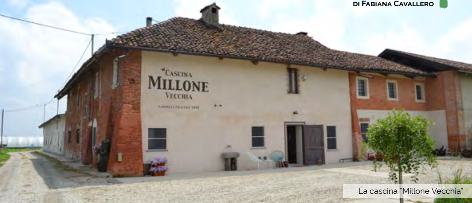
La cascina "Millone Vecchia"