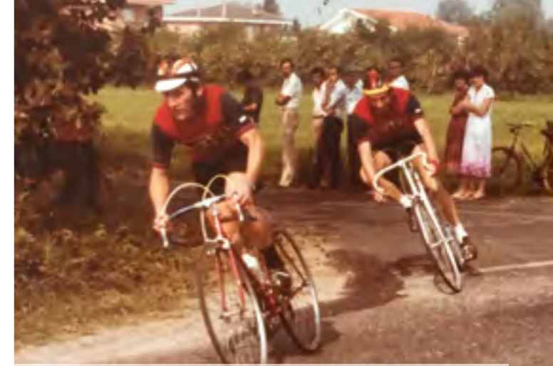
Una gara nel circuito scarnafigese (Pasero, Bellino)

Ancora oggi il gruppo dei "Ciapamusche" mantiene viva la passione per la bici nel nostro paese.