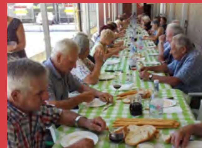
Pranzo con grigliata presso la bocciofila