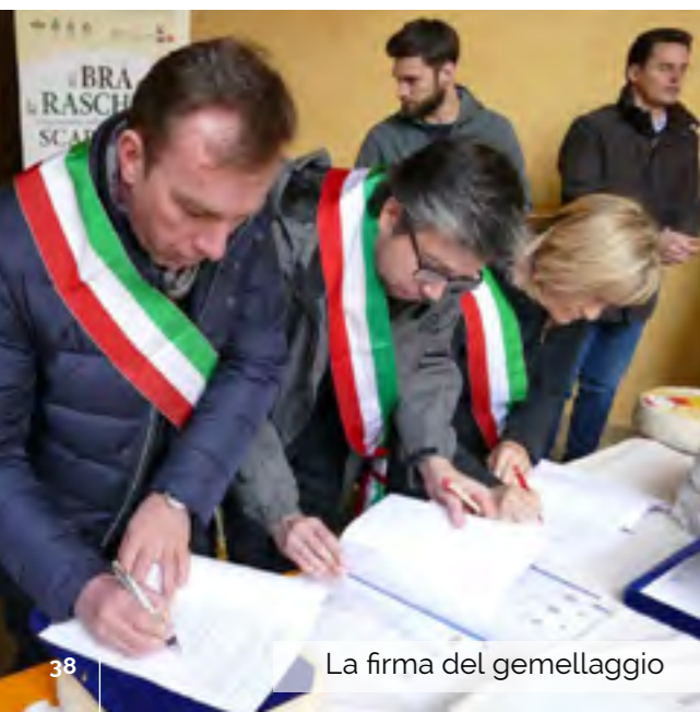
La firma del gemellaggio

Facciamo inoltre parte del Consorzio per la Tutela e Valorizzazione del Formaggio della Raschera, che comprende nove Comuni produttori del formaggio. Un plauso all'idea di favorire questa unione tra prodotti caseari tipici del territorio, a mio modo di vedere un ottimo modo per valorizzarne le peculiarità anche perché è sempre più complicato lavorare individualmente per favorire la promozione».